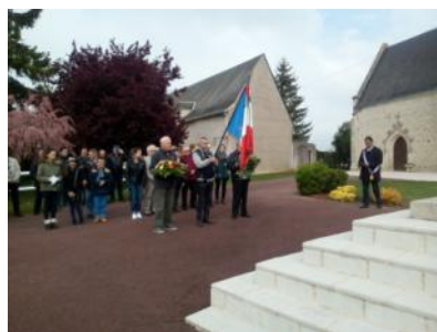
Remise des cartes d'électeurs aux jeunes de 18 ans.

SPECTACLE (offert par le Comité des Fêtes)